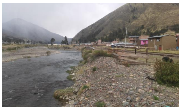
FOTO 06: Se aprecia aguas arriba asentamiento de APV en la margen izquierda aguas abajo del río Vilcanota Viviendas familiares.