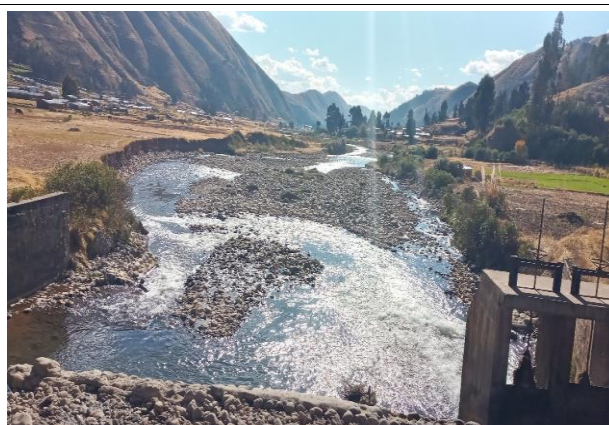
FOTO 01: Se aprecia el cauce del río Vilcanota colmatado con material canto rodado y hormigón y con taludes naturales en ambas márgenes. Los cuales al pie de talud de en cuenta erosión, sector Mamuera y Cuyo, Distrito de Marangani.