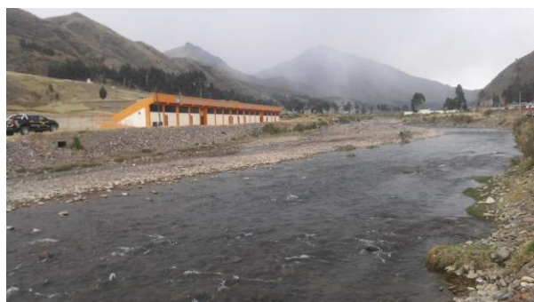
FOTO 03 y 04: Se aprecia el curso del agua por la margen izquierda afectada por la ribera con erosión y próximo la infraestructura de la línea férrea, localidad del distrito de Marangani.