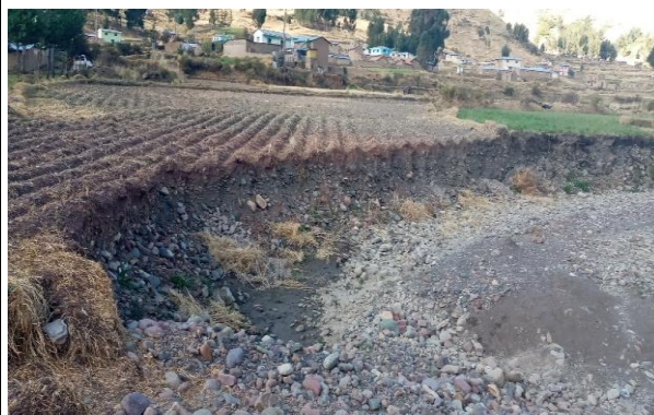
FOTO 05: Se aprecia áreas de cultivo afectados por la margen derecha aguas abajo del río Vilcanota. Comunidad campesina de Cuyo - Marangani.